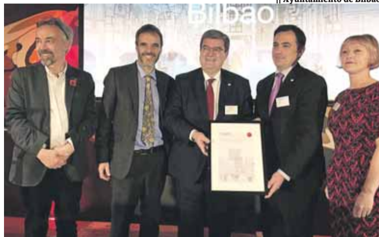
El alcalde bilbaíno, Juan Mari Aburto (en el centro), con el galardón.

El premio 'Mejor Ciudad Europea 2018' fue recogido por el alcalde de Bilbao, Juan Mari Aburto, quien declaró: "Estamos de enhorabuena. Bilbao ha hecho una gran transformación, pero el premio es por una ciudad que sigue en desarrollo, que se prepara para el futuro. Un futuro para los jóvenes, con